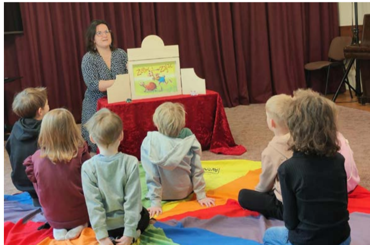
Ferie w bibliotece