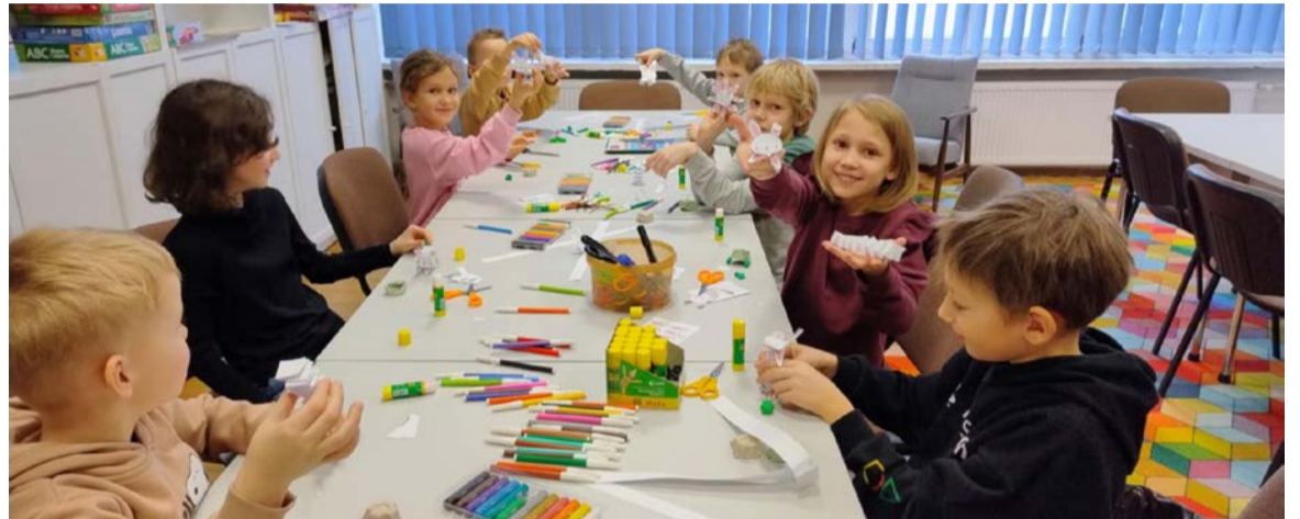
Ferie w bibliotece