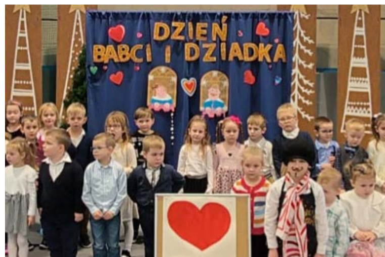
Babciom i Dziadkom życzymy dużo zdrowia, bo zdrowym seniorom łatwiej nadążyć za kilkulatkami i zrozumieć ich świat!

Młodzi artyści stanęli na wysokości zadania i doprowadzili swoich ukochanych dziadków do łez – publiczność płakała ze wzruszenia i ze śmiechu. Po spektaklu wnuki wręczyły samodzielnie przygotowane upominki, a następnie, siedząc na kolanach babci, zjadały się pysznymi wypiekami. Radosna atmosfera udzieliła się wszystkim zebranych.