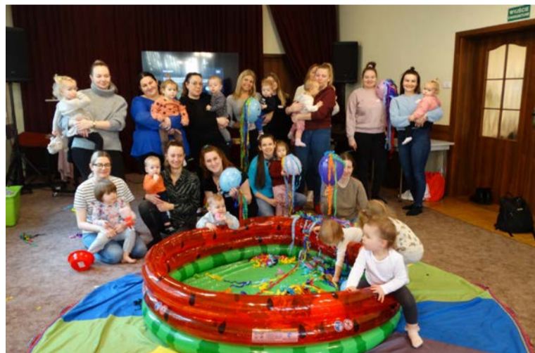
Wielki powrót bobasów!

tece w Obornikach, jak i w naszych filiach w Ocieszynie, w Popówku i w Rożnowie, odbywały się spotkania z grami planszowymi.