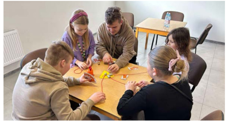
Ferie w bibliotece

Ferie zimowe już za nami. Biblioteka nie zapomniała w tym czasie o swoich najmłodszych czytelnikach. W pierwszym tygodniu zimowych wakacji zorganizowaliśmy pięć spotkań z teatrem kamishibai. Dzieci wzięły udział w zbieraniu śnieżynek, poznały historię Mikołaja Kopernika, dowiedziały się dlaczego żółw wygrał wyścig z zającem, zaprzyjaźniły się z pluszowym misiem i poznały Białą Damę z kórnickiego zamku. Ponadto, przez całe ferie, zarówno w biblio-