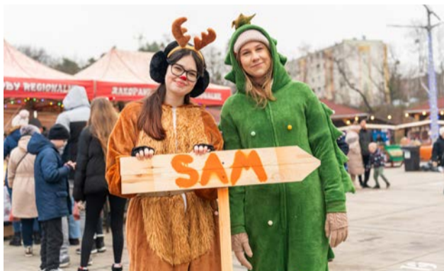
Stowarzyszenie Aktywizacji Młodych kierowało do swego stoiska w wyjątkowych strojach