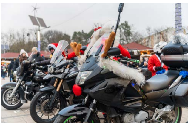
Jak święta to i Motomikołaje