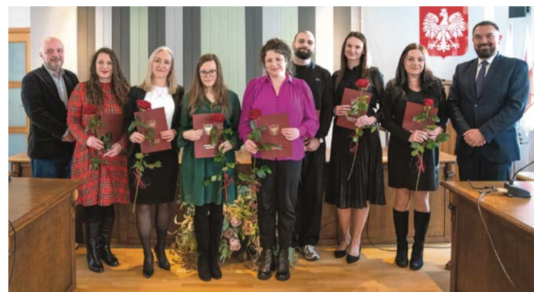
■ Nauczyciele mianowani z gminnych placówek edukacyjnych