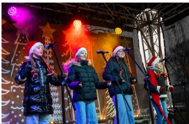
Na scenie rozbrzmiały kolędy