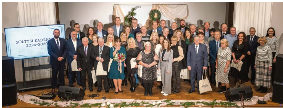
■ W wydarzeniu wzięli udział aktualni i byli sołtysi