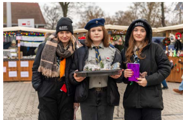
Można było spotkać też obornickich harcerzy