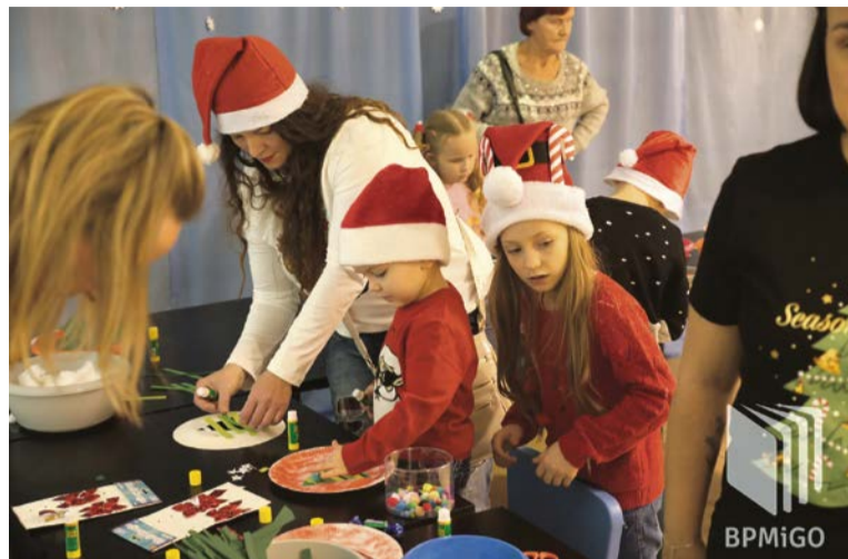
Świąteczna sobota w bibliotece

Nasi czytelnicy wiedzą jak umilić sobie czas oczekiwania na Święta Bożego Narodzenia. Dlatego tłumnie zjawili się w bibliotece w sobotni poranek, 7 grudnia, by przy dźwiękach świątecznych piosenek