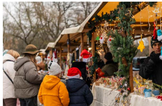
Każdy mógł znaleźć coś dla siebie