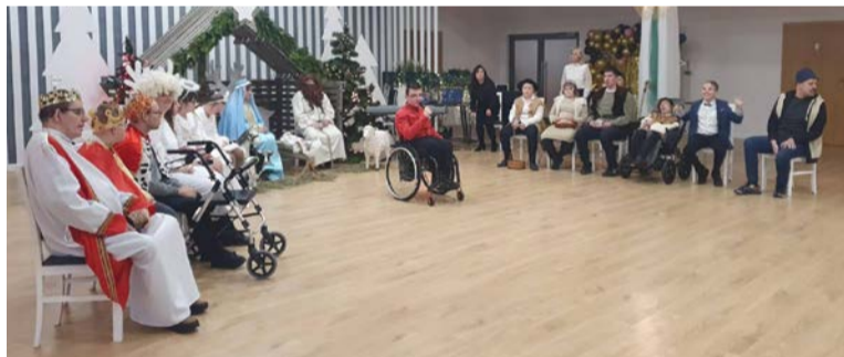
■ Piękne widowisko przygotowane przez podopiecznych „Przyjaciela”

W sobotę 14 grudnia, miała miejsce wyjątkowa uroczystość – wigilia Stowarzyszenia Pomocy Dzieciom i Młodzieży Niepełnosprawnej „Przyjacieli”. To wydarzenie, pełne ciepła i wspólnoty, zgromadziło licznych gości, wolontariuszy oraz podopiecznych i ich bliskich, którzy wspólnie świętowali nadchodzące Święta Bożego Narodzenia.