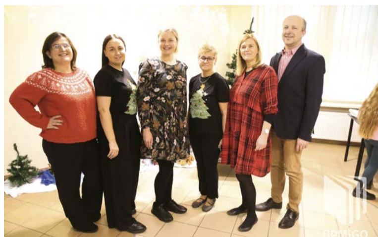
Świąteczna sobota w bibliotece

tworzyć pocztówki, wianki i prace plastyczne. Spotkaniu towarzyszył lubiany przez najmłodszych teatr kamishibai, a także zagadki i prezentacje.