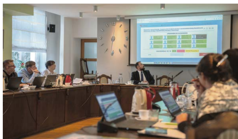
Budżet na rok 2025 uchwalono jednogłośnie