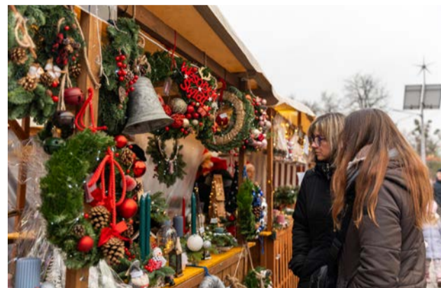
I mnóstwo pięknych dekoracji na święta