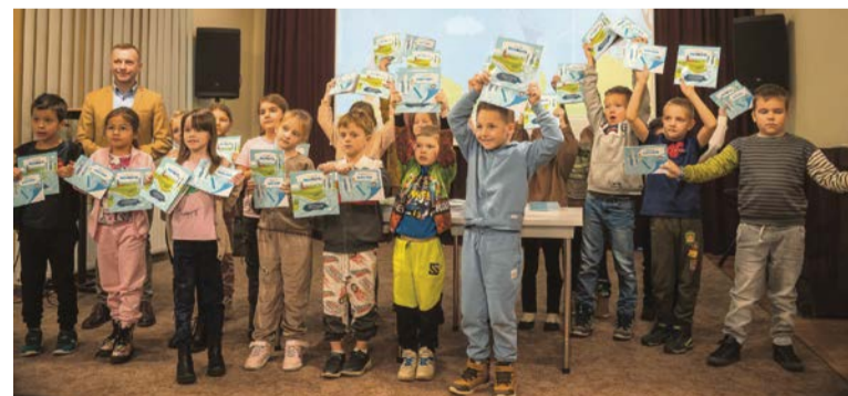
W Obornikach pełna kultura: bez śmieci jest każda rura

przyznanemu przez Wojewódzki Fundusz Ochrony Środowiska i Gospodarki Wodnej w Poznaniu. Celem projektu jest nie tylko edukacja, ale także budowanie świadomości ekologicznej oraz rozwijanie w młodym pokoleniu szacunku dla przyrody i troski o zasoby naturalne. Materiały edukacyjne, takie jak film animowany, kolorowanki i komiksy, zostały wzbogacone o elementy architektury Obornik, co pozwala dzieciom lepiej identyfikować się z przekazywanymi treściami i zwiększa ich poczucie odpowiedzialności za lokalne środowisko.