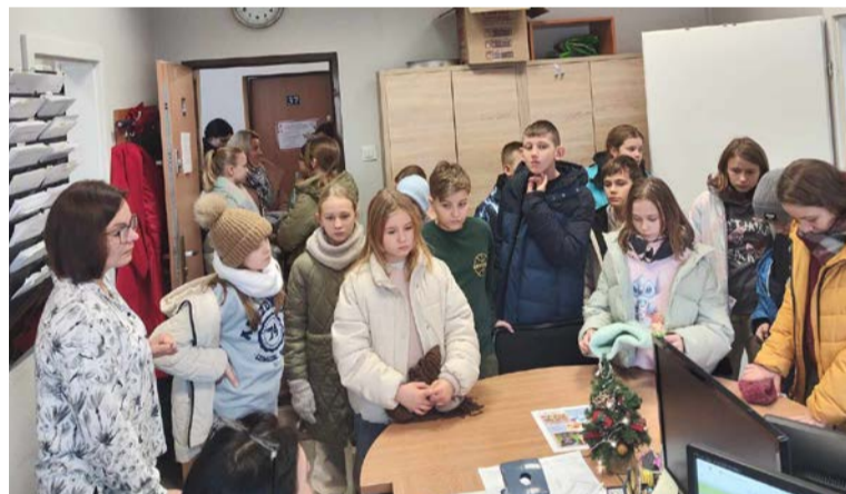
Uczestnicy projektu poznawali codzienność OPS

Otrzymywane wyróżnienia dają z pewnością energię do dalszej pracy, gdyż w listopadzie w Ośrodku Pomocy Społecznej ruszyła realizacja dwóch projektów socjalnych. Jednym z nich jest projekt pt. „OPS – bliżej nas”, którego celem jest, m.in. przybliżenie mieszkańcom gminy Oborniki działalności ośrodka. W pierwszej kolejności działania adresowane są do najmłodszych mieszkańców, którzy podczas organizowanych spotkań będą mogli zapoznać się z ofertą pomocy dla osób znajdujących się w różnych sytuacjach życiowych, zgłębić wiedzę dotyczącą zawodów oraz poznać specyfikę pracy.