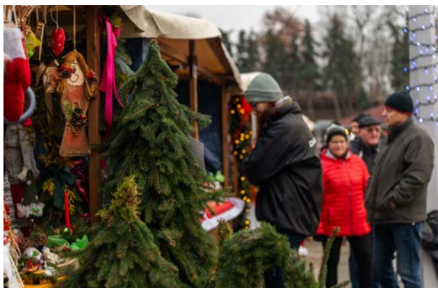
Na uczestników czekało blisko 80 wystawców