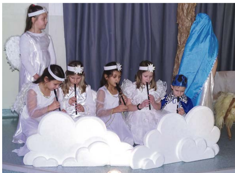
■ Pochwaliły się też talentem i pracą

Przegląd Zespołów Kolędniczych i Jasełkowych Chrustowo 2024 był nie tylko artystycznym wydarzeniem, ale również świętem tradycji i wspólnoty. Dzięki takim inicjatywom możliwe jest ocalenie i przekazywanie pięknych zwyczajów kolędowania kolejnym pokoleniom. Wszyscy uczestnicy zgodnie podkreślali, że z niecierpliwością czekają na przyszłoroczną edycję tego wyjątkowego wydarzenia.