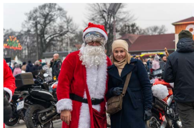
Nie zabrakło też Mikołaja