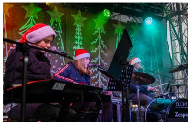
Zespół Taldeo zaprezentował się świetnie