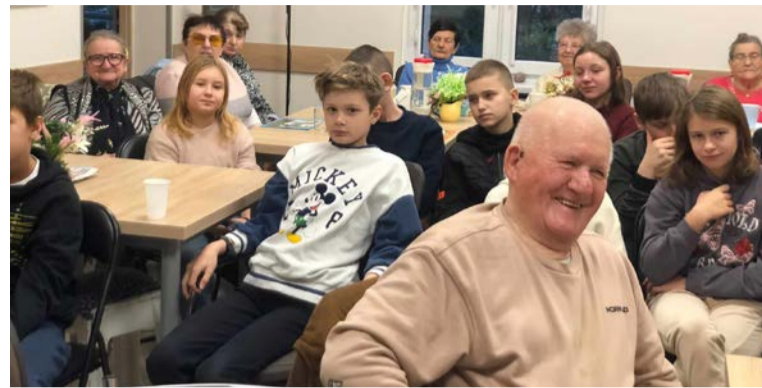
Dzieci odwiedziły seniorów z „Jagiellonki”

21 listopada Ośrodek Pomocy Społecznej w Obornikach odwiedziły dzieci z „Zaczarowanego Przedszkola”, które pod czujnym okiem wychowawcy zwiedziły siedzibę ośrodka. Przedszkolaki dowiedziały się z jakimi sprawami mogą zgłosić się do OPS oraz jakie osoby zatrudnione są w placówce. Ponadto, asystent rodziny przeprowadził zabawę, podczas której dzieci wykazały się zdobytą wiedzą i umiejętnością pracy w grupie. Odwiedziny zakończyły się poszukiwaniem ukrytego skarbu w biurze Pani Dyrektora. Wizyta ta napędza nas optymizmem, gdyż przedszkolaki obiecały powrót do ośrodka w roli pracownika, jak powiedziała jedna z dziewczynek „też chce pomagać innym”.