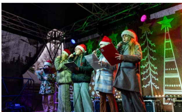
Wokaliści na co dzień ćwiczący w OOK przyciągnęli grono fanów