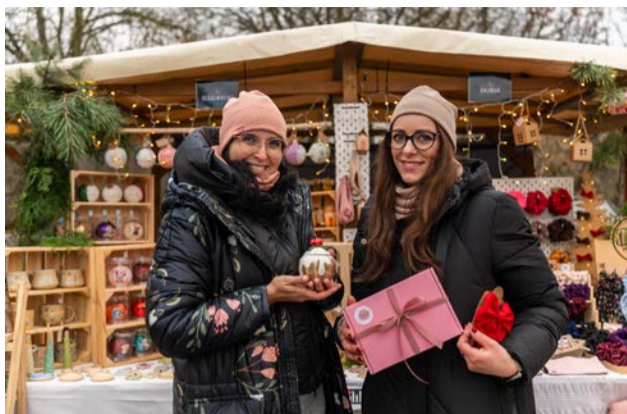
Nie ma jarmarku bez naszych rękodzielniczek