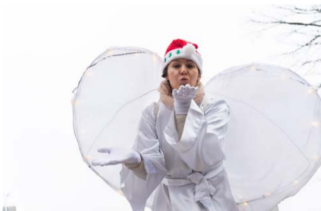
Nie zabrakło świątecznego anioła