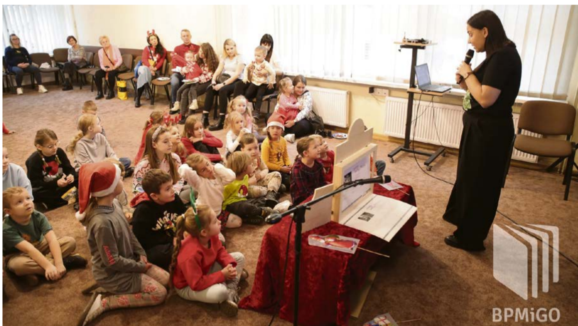
Świąteczna sobota w bibliotece