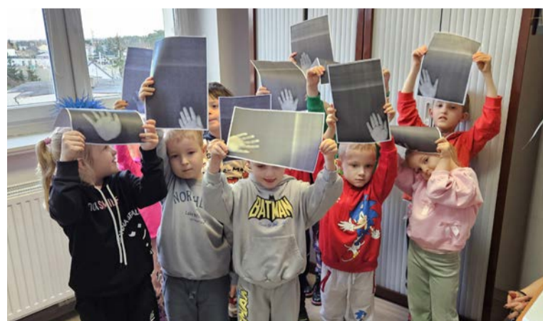
Było też sporo dobrej zabawy

Wystawa jest częścią projektu realizowanego przez Fundację Nasze Podwórko w partnerstwie z Biblioteką, a dofinansowanego ze środków Samorządu Województwa Wielkopolskiego.