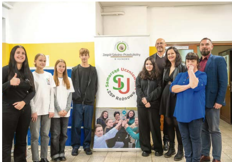
Uczniowie nie kryją radości z informacji o planowanej inwestycji