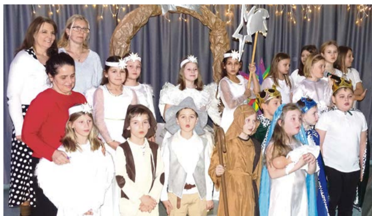
■ Dzieci zaprezentowały się znakomicie