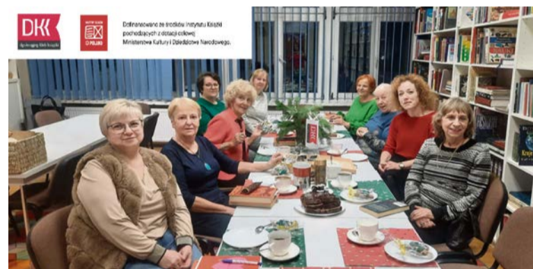
Grudniowe spotkania Dyskusyjnych Klubów Książki

Deweya w Obornikach zapoznali się z działaniami PWiK dotyczącymi dbania o sieć wodociągową i kanalizacyjną. Podczas spotkania dzieci obejrzały film animowany, którego bohaterem jest WełnWart – postać związana z rzekami Wełna i Warta, wprowadzająca młodych mieszkańców w świat odpowiedzialnych postaw wobec środowiska. Film został wyprodukowany przez PWiK we współpracy z agencją Nonoproblemo dzięki dofinansowaniu w wysokości 47 190 zł