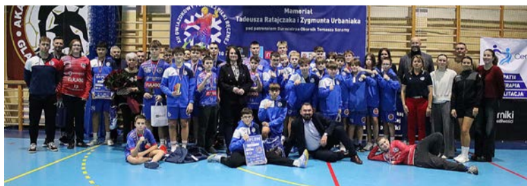
Turnieje przyciągają rzesze kibiców

20-22 grudnia odbył się natomiast XII Gwiazdkowy Turniej Piłki Ręcznej Młodzików 2010