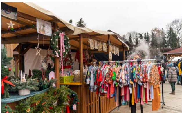
Na klientów czekały nawet wysokiej jakości ubranka dla dzieci