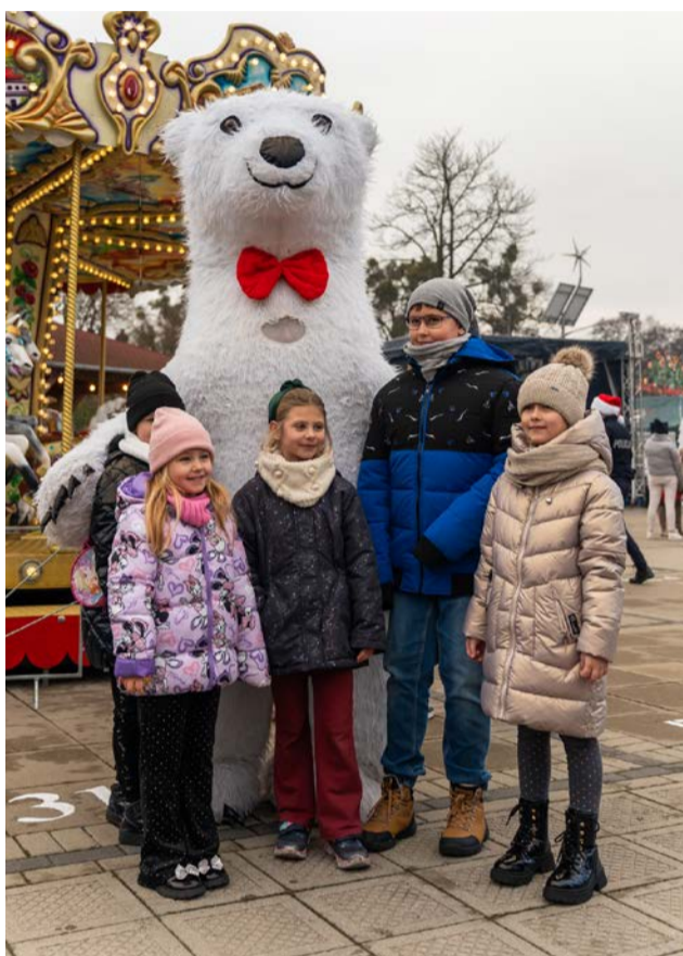
Miś Lolo rozbawiał dzieci