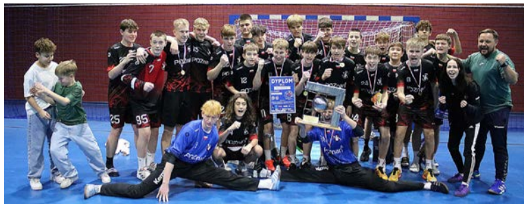
Nasi szczypiornicy pokazują klasę

Natomiast w dniach 13-15 grudnia 2024 r. w Obornikach rozgrywany był Ogólnopolski Turniej Piłki Ręcznej Chłopców 2011 i młodsi o Puchar Ministra Roz-