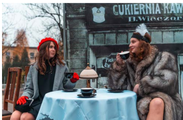
Szkoła Podstawowa nr 4