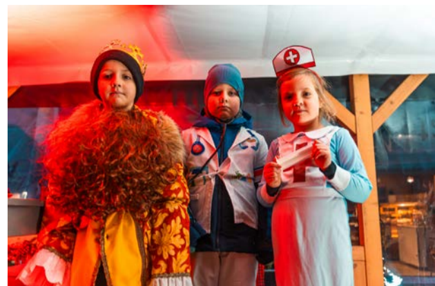
Zespół Szkolno-Przedszkolny z Chrustowa