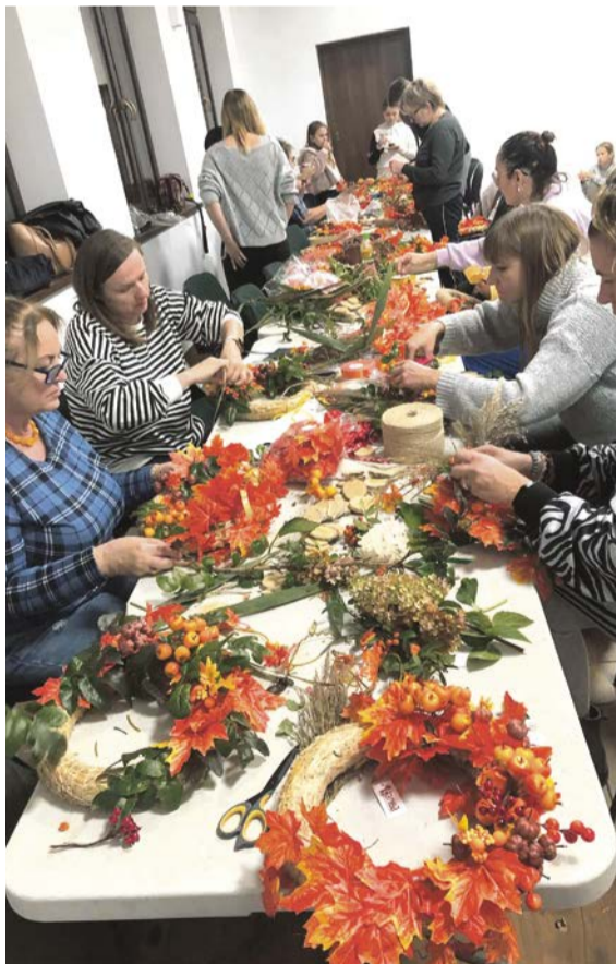
■ Warsztaty – projekt Działaj Lokalnie w Uścikówcach