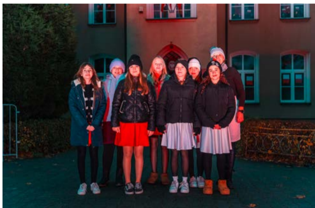
Zespół Szkolno-Przedszkolny z Rożnowa