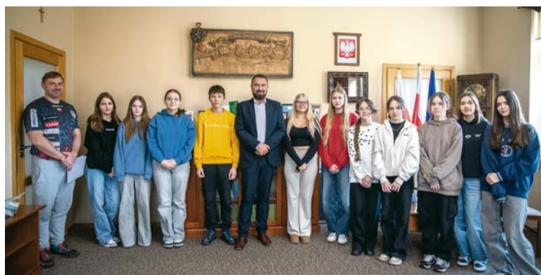
■ Młodzież zwiedzała wydziały Urzędu Miejskiego