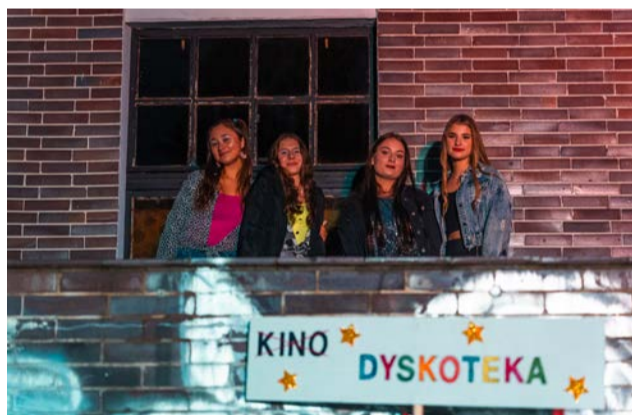
Zespół Szkół – Oborniki