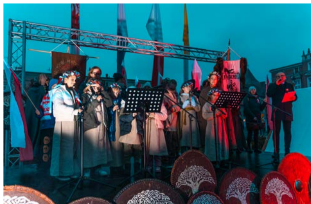
Zespół Szkolno-Przedszkolny z Maniewa