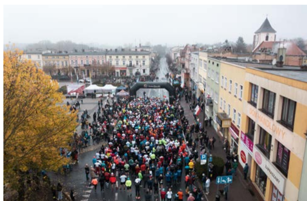
XV Bieg Niepodległości