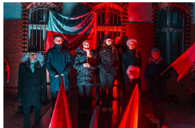
Zespół Szkolno-Przedszkolny z Kiszewa