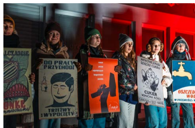
Szkoła Podstawowa nr 3