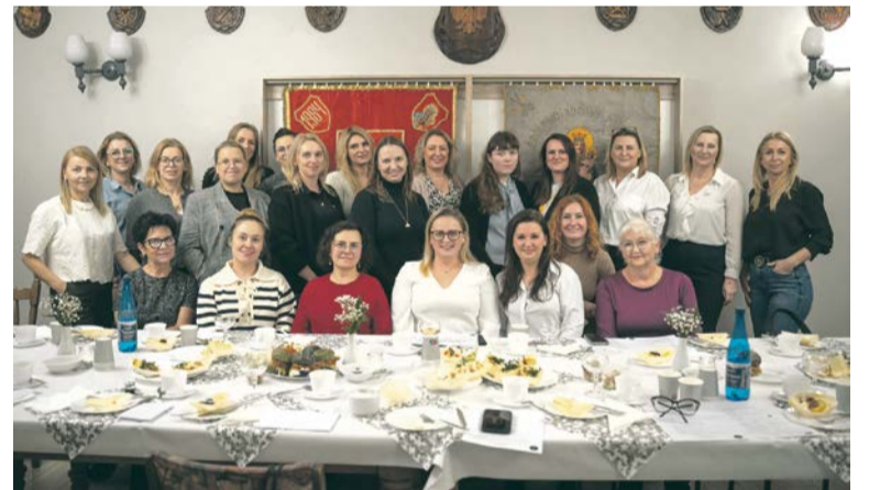
■ Spotkanie – projekt Kobieca strona rzemiosła