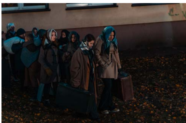
Szkoła Podstawowa nr 2