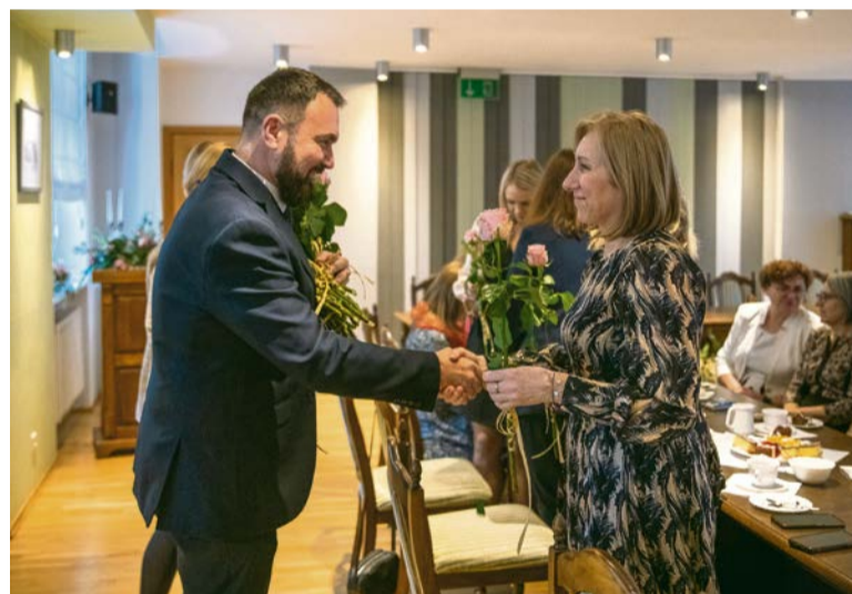
■ Burmistrz pogratulował pracownikom OPS