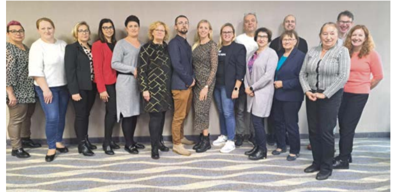
■ Rada i Zarząd LGD Kraina Trzech Rzek

Rok 2024 był pełen wyzwań i sukcesów, a nasze Stowarzyszenie, dzięki zaangażowaniu lokalnej społeczności, mogło realizować wiele przedsięwzięć i stawiać sobie ambitne cele na 2025 rok.