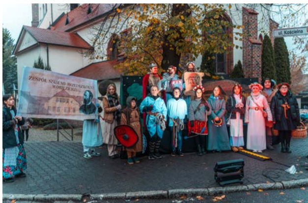
Zespół Szkolno-Przedszkolny z Objezierza