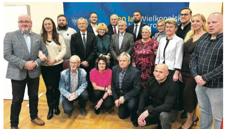
■ Sołtysi – Forum Wielkopolska Wieś Europejska