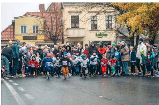
Biegi dzieci i młodzieży