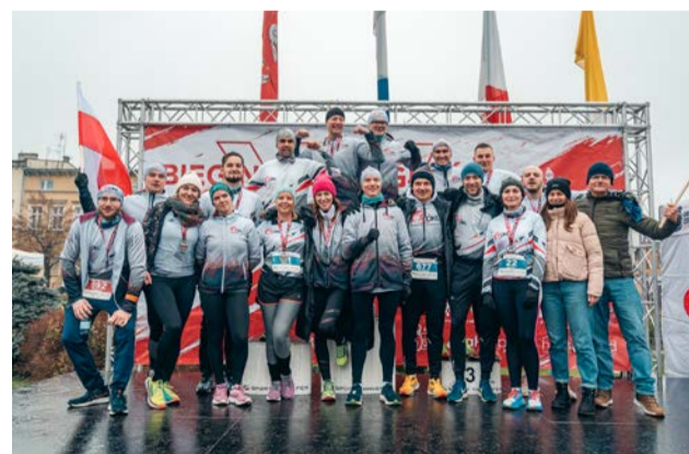
XV Bieg Niepodległości