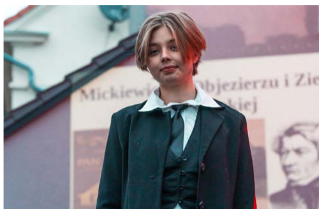
Zespół Szkół – Objezierze