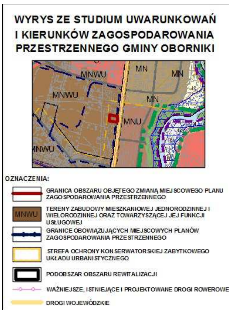
Ryc. 2. Obszar objęty zmianą planu na tle wrysu ze Studium Uwarunkowań i Kierunków Zagospodarowania Przestrzennego Gminy Oborniki