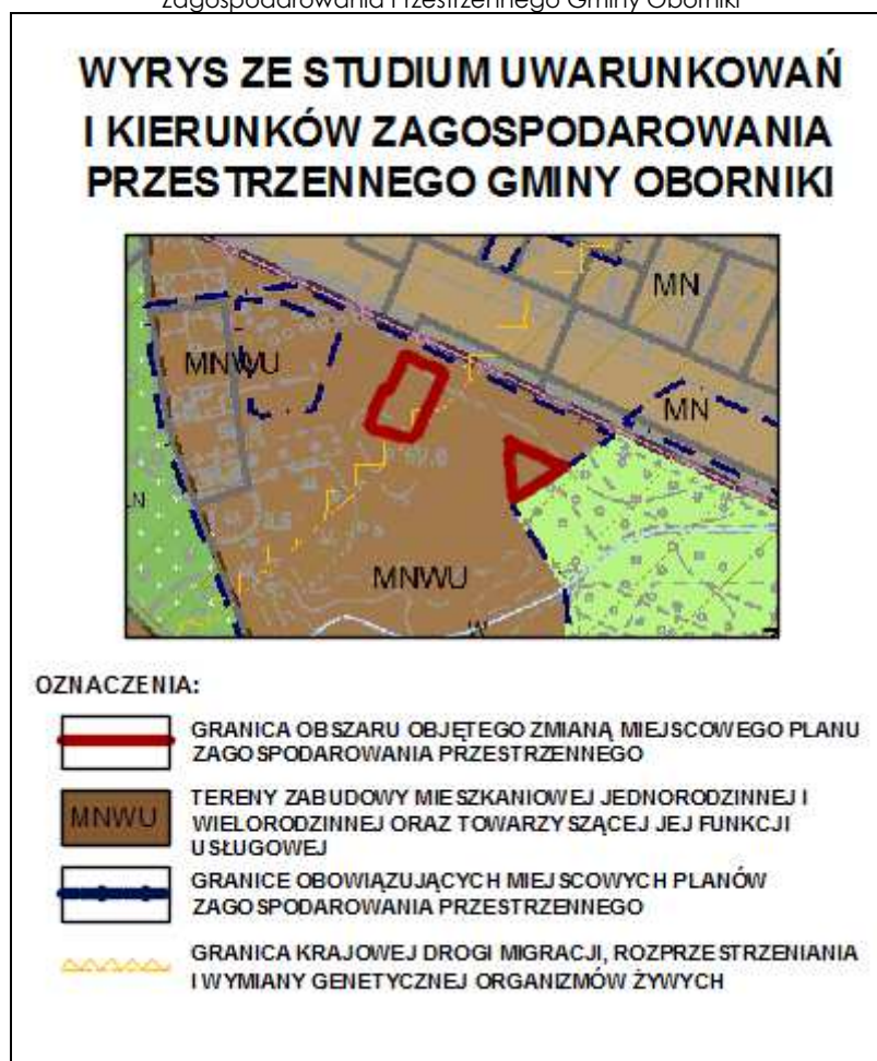
Ryc. 1. Obszar objęty zmianą planu na tle wyrysu ze Studium Uwarunkowań i Kierunków Zagospodarowania Przestrzennego Gminy Oborniki