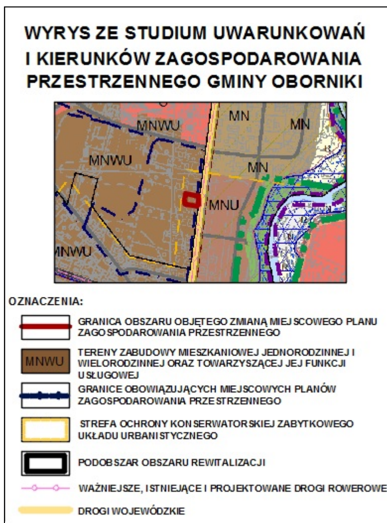
Ryc. 2. Obszar objęty zmianą planu na tle wyrysu ze Studium Uwarunkowań i Kierunków Zagospodarowania Przestrzennego Gminy Oborniki