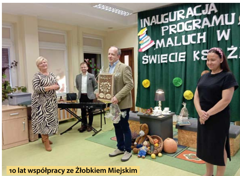
10 lat współpracy ze Żłobkiem Miejskim

Strona pod redakcją Biblioteki Publicznej Miasta i Gminy im. Antoniego Małeckiego w Obornikach