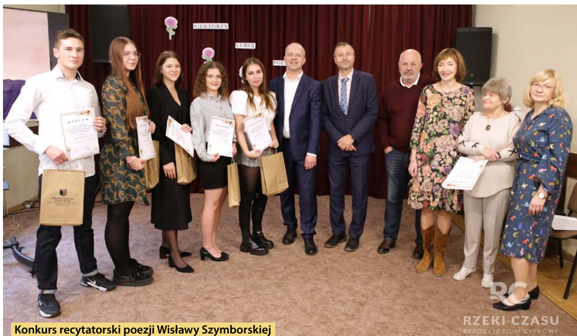
Konkurs recytatorski poezji Wisławy Szymborskiej