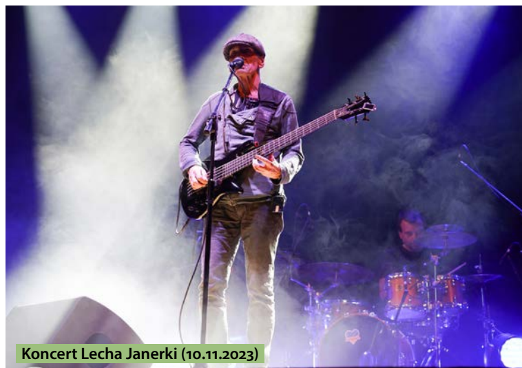
Koncert Lecha Janerki (10.11.2023)