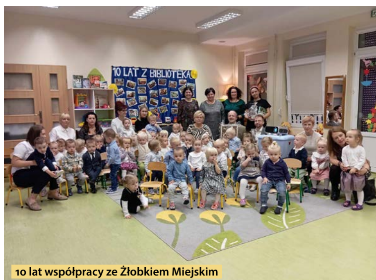
10 lat współpracy ze Żłobkiem Miejskim