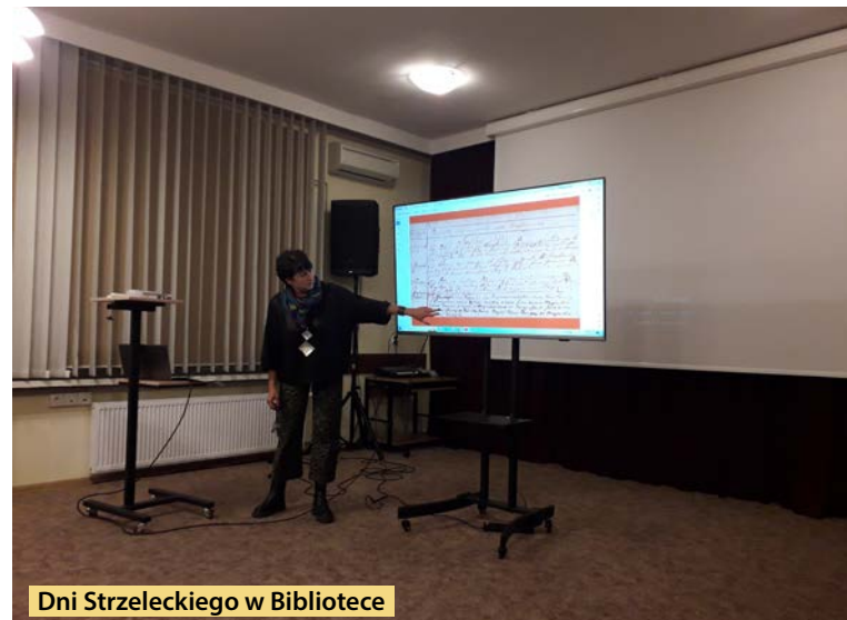
Dni Strzeleckiego w Bibliotece