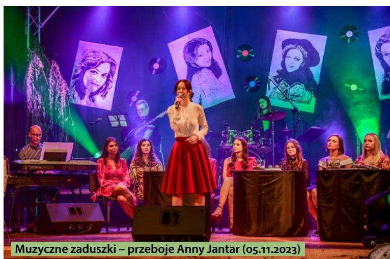
Muzyczne zaduszki – przeboje Anny Jantar (05.11.2023)