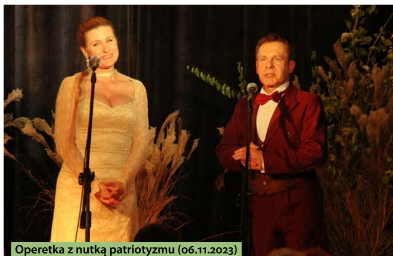
Operetka z nutką patriotyzmu (06.11.2023)