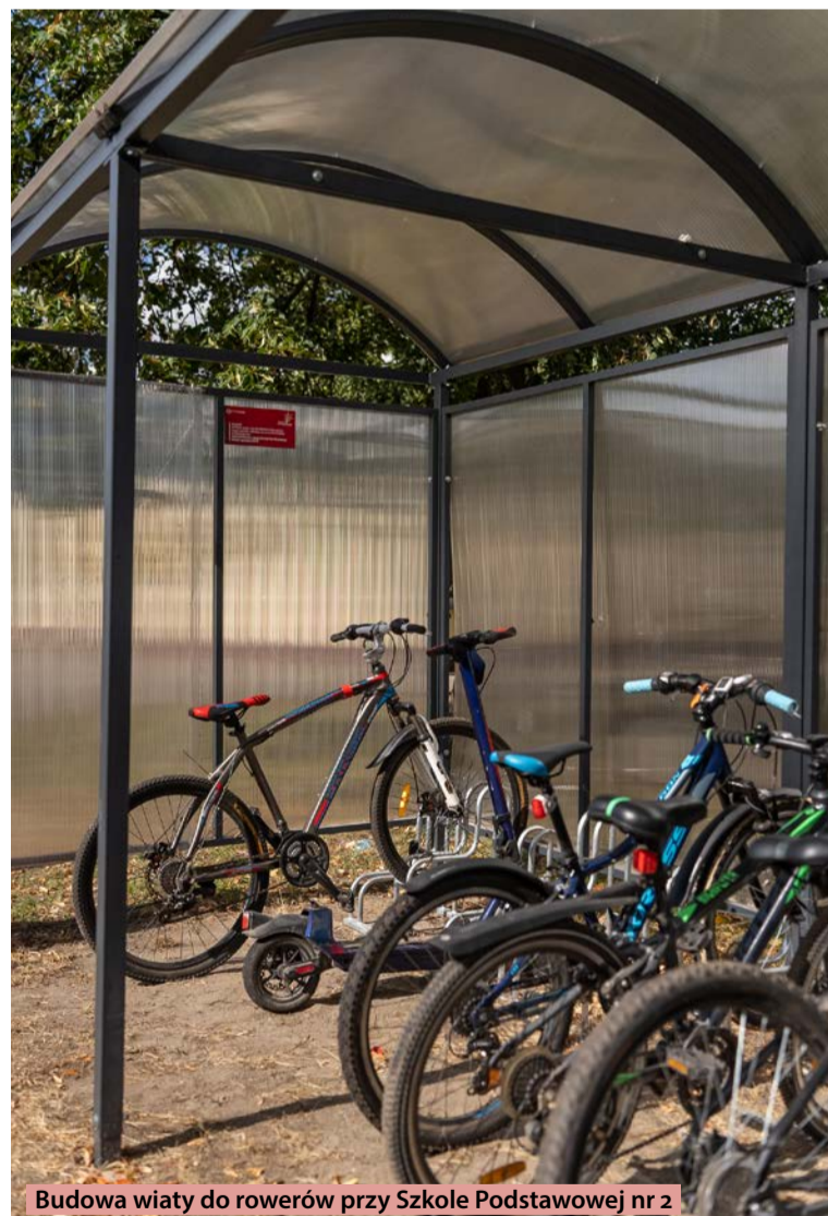
Budowa wiaty do rowerów przy Szkole Podstawowej nr 2