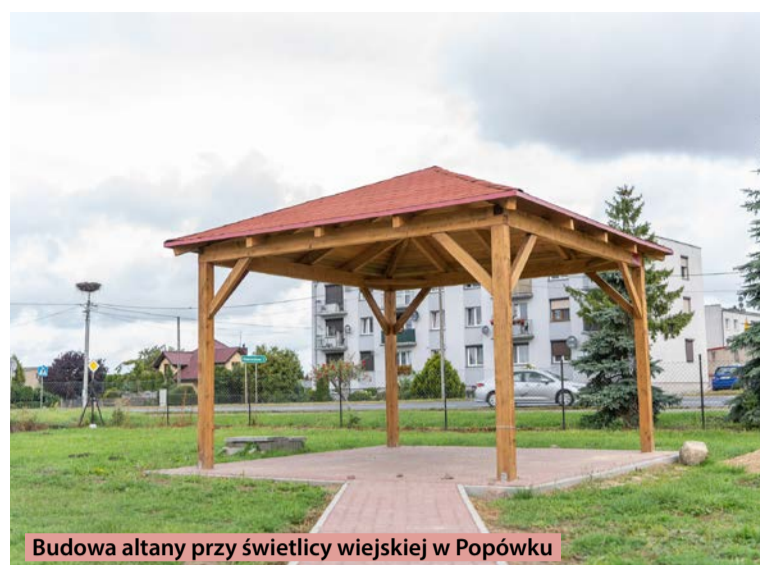
Budowa altany przy świetlicy wiejskiej w Popówku