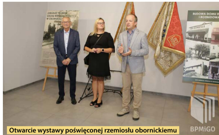
Otwarcie wystawy poświęconej rzemiosłu obornickiemu

Z okazji obchodów 70-lecia Cechu Rzemiosł Różnych w Obornikach w sobotę, 9 września,