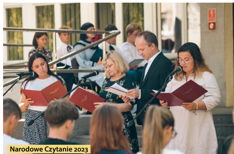
Narodowe Czytanie 2023