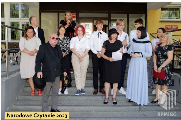
Narodowe Czytanie 2023

Lekturą 12. odsłony Narodowego Czytania było "Nad Niemnem" Elizy Orzeszkowej. Biblioteka Pu-