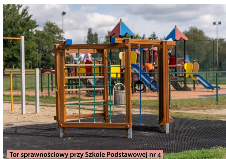
Tor sprawnościowy przy Szkole Podstawowej nr 4