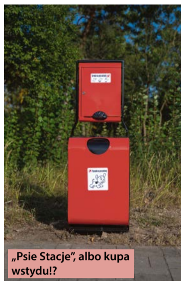
„Pse Stacje”, albo kupa wstydu!?