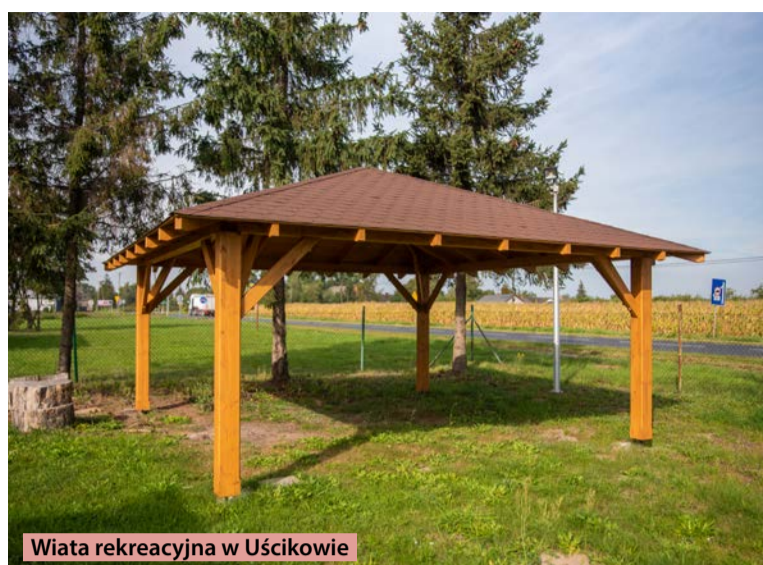
Wiata rekreacyjna w Uścikowie

Jak zgłosić swoją propozycję? To bardzo proste! Wystarczy wejść na stronę oborniki.pl , kliknąć w zakładkę Budżet Obywatelski (aktywny do 2 października), a następnie wypełnić zamieszczony tam formularz, wskazując planowaną inwestycję, jej koszt i lokalizację, a także krótko opisać projekt. Do zgłoszenia należy dołączyć listę 15 osób, popierających projekt oraz wycenę planowanej inwestycji, zawierającą koszty wykonania lub zakupu oraz montażu.